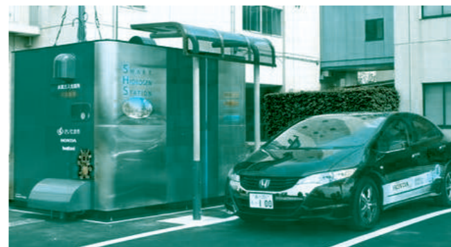
パッケージ型の「スマート水素ステーション」(ソーラなどの電力で水から水素をつくる事が出来る)(左)とリース販売限定の燃料電池車「FCXクラリティ」(右)