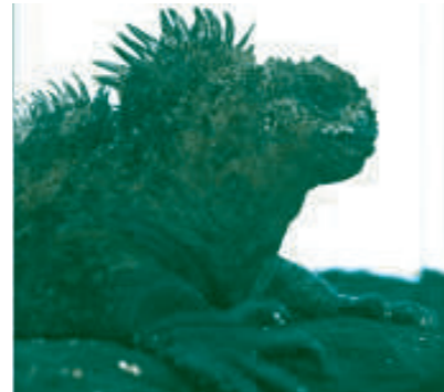
海の生活に適応したウミイグアナ

に洗い流すというルールがあります。この理由はそれぞれの島で色々な固有種の動植物が生息しており、生態系を乱さないようにするためです。代表的な生物であるガラパゴスの語源となったゾウガメ、そして独特な進化を遂げた