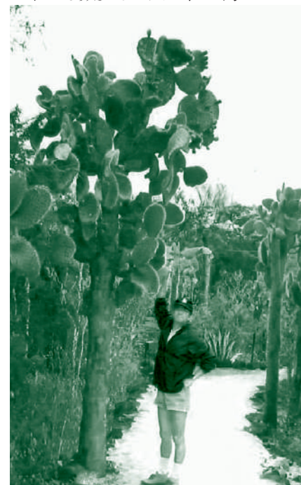
木性化したうちわサボテン

我々はバスでバルトラ島を横断し、小舟を乗り継いでサンタクルス島へ移動しました。この島はガラパゴス諸島のクルーズの中心となっており、ホテルや商店街があり、島々の中でも数少ない人が住む島の一つです。そこにはチャー