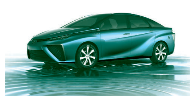
トヨタの燃料電池車「ミライ」

トヨタ自動車は昨年12月に燃料電池自動車(FCV)「MIRAI(ミライ)」を世界で初めて市販した。更に今年1月にはFCVに関連する同社の5680件の特許権を無償で提供すると発表し大きな話題になった。