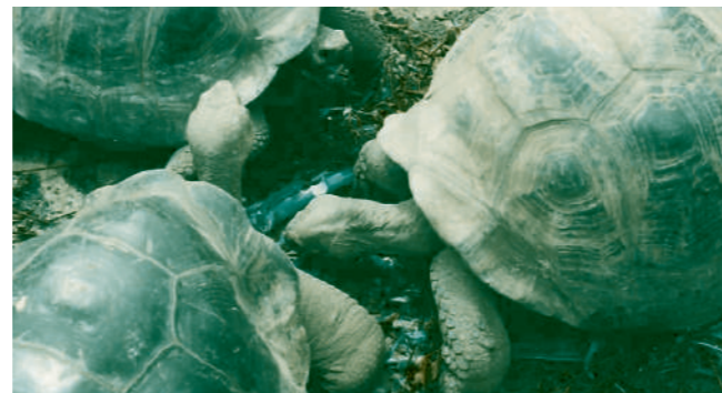
ガラパゴスゾウガメ

上陸すると決められたルートをナチュラルリストの案内で動植物を観察します。それぞれの島で見られる特殊な動植物の説明はここでは割愛させていただきますが毎日が新しい発見と驚きの連続でした。